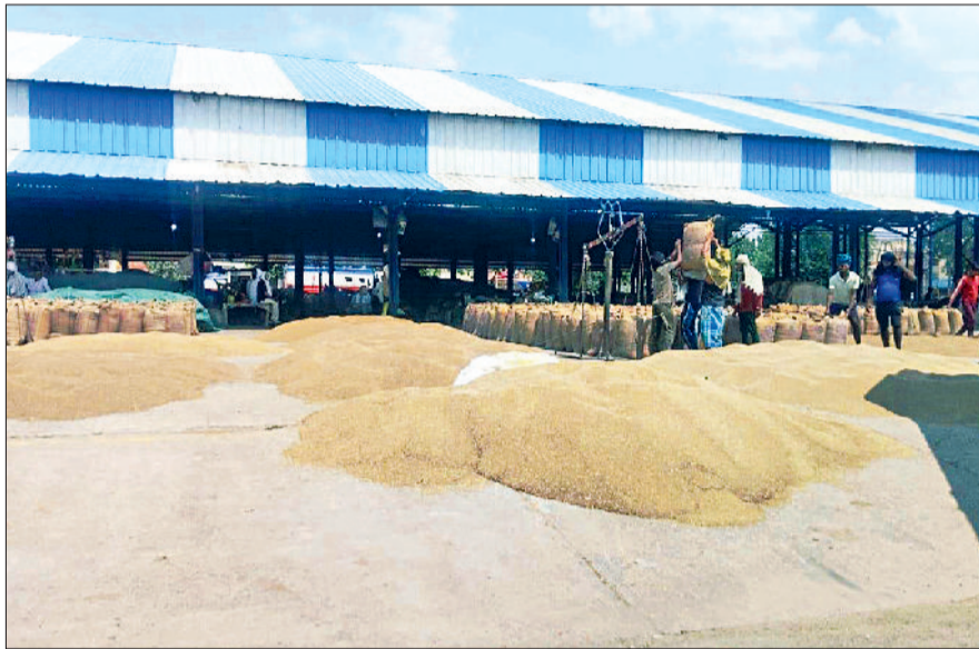
रेवाड़ी। अनाजमंडी में लगी बाजरे की ढेरियां।