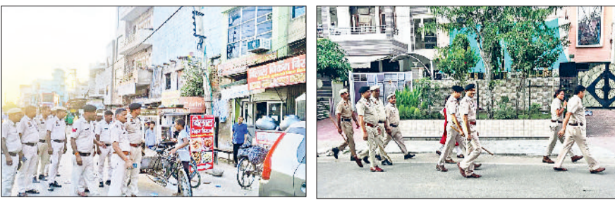
रेवाड़ी। अपने-अपने क्षेत्रों में पैदल गश्त करते हुए थाना प्रभारी।