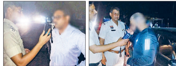
रेवाड़ी। वाहन चालकों की मीटर से जांच करते हुए पुलिसकर्मी।