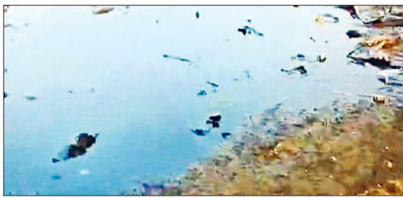
बावल। औद्योगिक एरिया में एकत्रित दूषित पानी।

एचएसआईआईडीसी के अधीन वाली आने वाली कंपनियों का दूषित पानी बिना ट्रीट किए ही सीवर लाइनों में छोड़ा जाता है। निगम संबंधित कंपनियों को नोटिस तो जारी करता है, परंतु बाद में कार्रवाई के नाम पर कुछ नहीं होता। वीरवार को एचएसआईआईआईडीसी कार्यालय पर सीएम फ्लाइंग की रेट के बाद इस बात का खुलासा हुआ है। फ्लाइंग ने इसकी रिपोर्ट निगम के एमडी को प्रेषित की बरसात के है। सीएम फ्लाइंग की समय रेट से निगम दूषित पानी कार्यालय में हड़कंप लोगों के की स्थिति बनी रही। घरों तक में बावल क्षेत्र के गांव घुस गया पातुहेड़ा, बनीपुर था और आसलवास आदि गांवों की सीमा में भारी मात्रा में उद्योगों का दूषित पानी छोड़ा जा रहा है। बरसात के समय दूषित पानी गांवों की गलियों से होकर लोगों के घरों तक में घुस गया था। ग्रामीण आरोप लगाते रहे हैं कि एचएसआईआईआईडीसी के अधीन आने वाले उद्योग पानी को ट्रीट किए बिना ही सीवर लाइनों