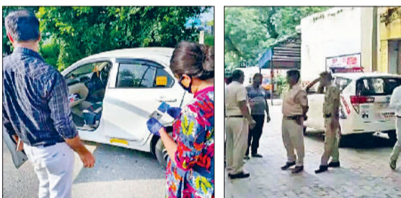
रेवाड़ी। मृतक की कार की जांच करते सीन ऑफ क्राइम टीम व पोस्टमार्टम कराने के लिए अस्पताल में मौजूद पुलिसकर्मी।

इसके बाद वह घर नहीं लौटा। वीरवार सुबह एक शव पेड़ से लटका हुआ देखकर लोगों ने इसकी सूचना पुलिस को दी। सूचना मिलने के बाद मौके पर पहुंची पुलिस ने शव को कब्जे में