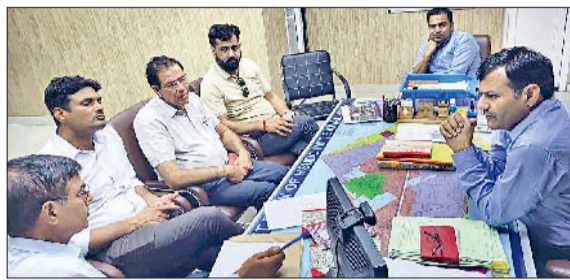
बावल। एचएसआईआईआईडीसी अधिकारियों से बातचीत करते हुए सीएम फ्लाइंग।

के समय पानी घरों में घुसने के बाद ग्रामीणों ने एचएसआईआईआईडीसी के खिलाफ प्रदर्शन भी किया था। इसके बाद एसडीएम बावल ने बिना ट्रीट किया हुआ पानी छोड़ने पर एचएसआईआईआईडीसी और सिंचाई विभाग के अधिकारियों को भी तलब किया था। एसडीएम ने ग्रामीणों को आश्वासन दिया था कि दूषित पानी किसी भी सुरत में नहर में नहीं छोड़ने दिया जाएगा।